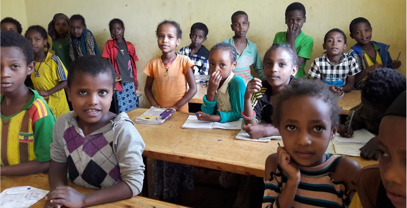
Kuva: Limun kummilapsia Etiopiassa