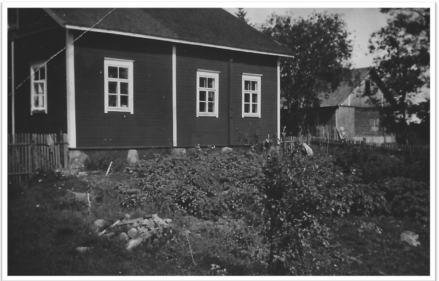
Kuva: Juosila 1930-luvulla

Meillä oli mukanaamme tabletilla vanhoja valokuvia ja tutkailimme niistä Juosilan tilan entistä ulkoasua. 1930-luvun valokuva, jossa näkyy talo ja sen takana suuri piharivi, osoittaa navetan sijainneen piharivin oikean puoleisessa päädyssä, osana isoa rakennuskokonaisuutta. Tutkimme kivijalan edustaa ja löysimme siitä navetan lautarakenteisen etuhuoneen peruskivet. Myös navetan vasemmalta puolelta löytyi rakennuksen peruskiviä.