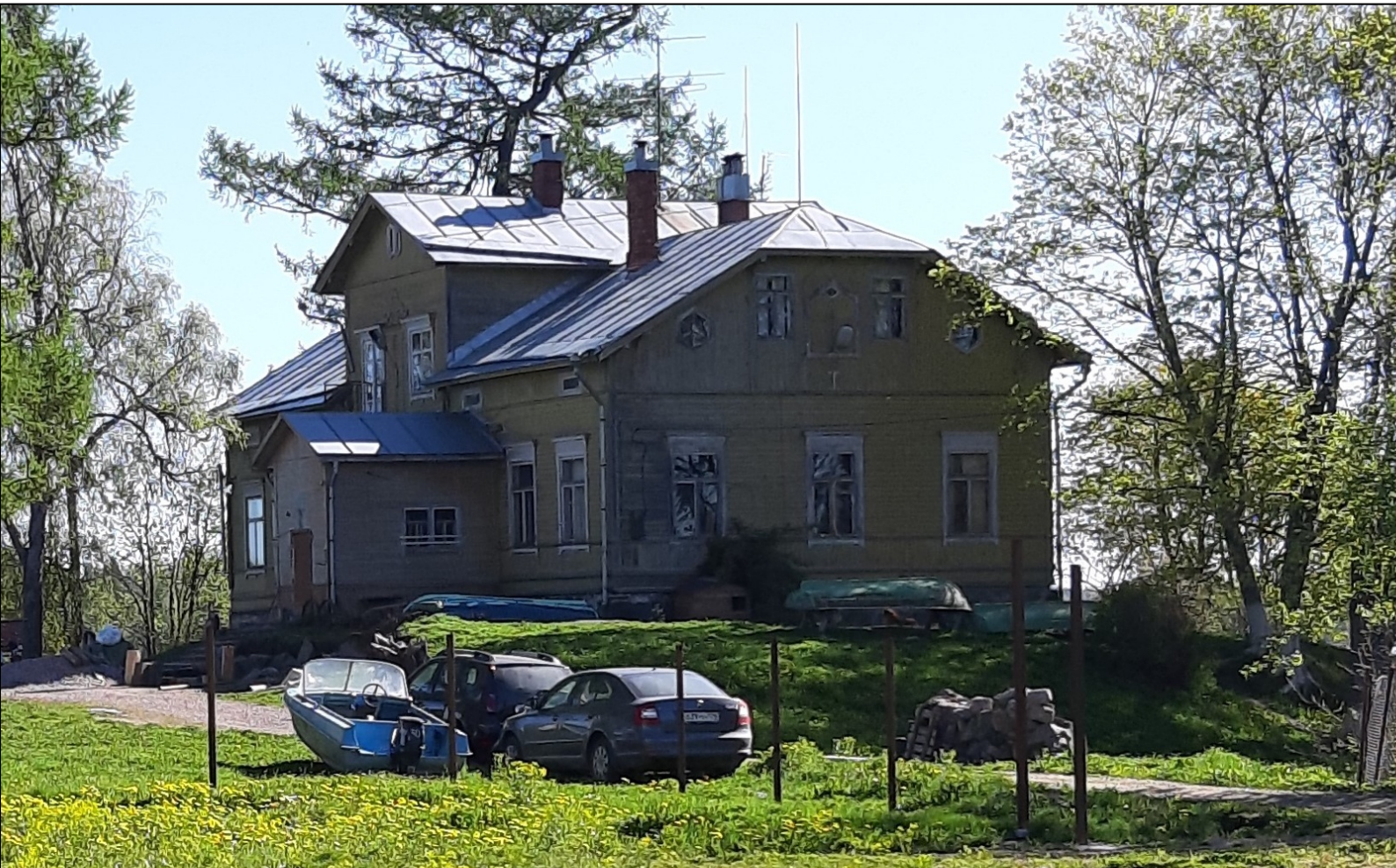
Kuva: Pukinniemen hovin v. 1880 valmistunut päärakennus nykyasussaan.

yksityisomistuksessa. Bussin käänköpaikalta oli lyhyt kävelymatka kylän raittia pitkin rantaan ja hovin rakennus on osa elävää kyläyhteisöä.