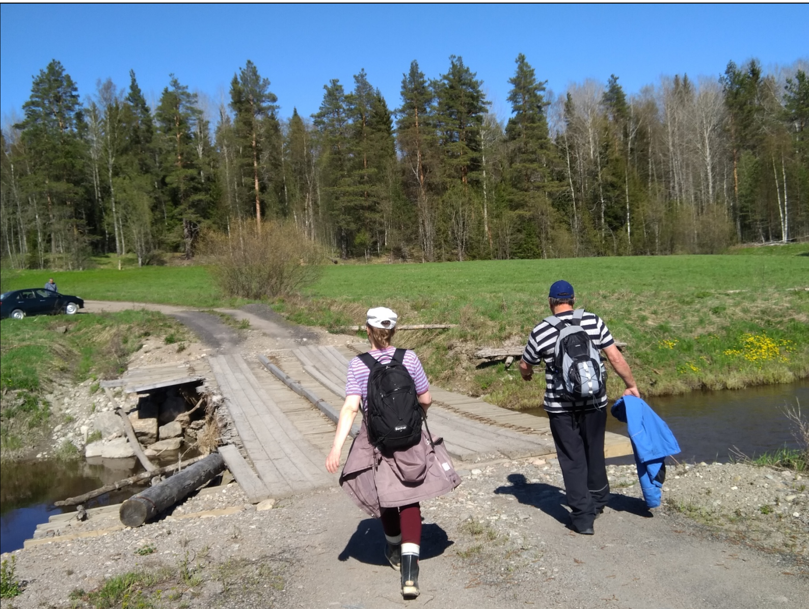
Kuva: Paluu Ilmeenjoen sillalle

onnistuimme. Tie lähtikin arvioitua lähempää, miltei Juosin talon kohdalta. Se on erkaantunut Pukinniemen tiestä hieman kaartaen ja kaarteeseen kohtaan oli kaatunut kookas, vielä kasvava paju, joka peitti tiepohjan. Kun pajun kiersi, niin edessä avautui metsää halkova selkeä tielinjaus, reitti Marjakoskelle.