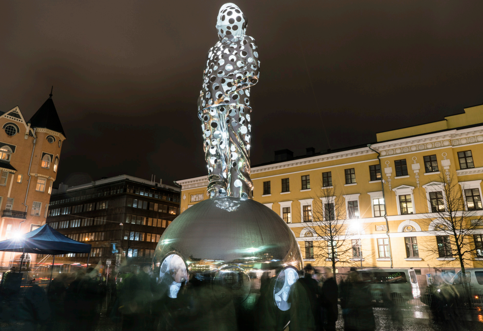
Kuva: Talvisodan kansallinen muistomerkki Helsingin Kasarmitorilla pääesikuntaa vastapäätä, Pekka Kauhanen, 2017, Helsingin kaupunginmuseo. Kuvaaja: Maija Toivonen