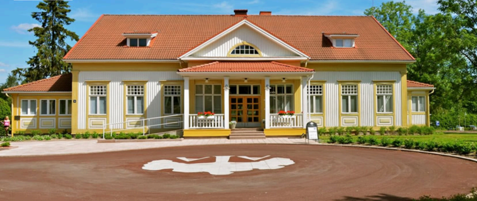
Kuva: Mykrien sukujuhlaa 2020 vietetään Ahlströmin Ruukissa Noormarkussa