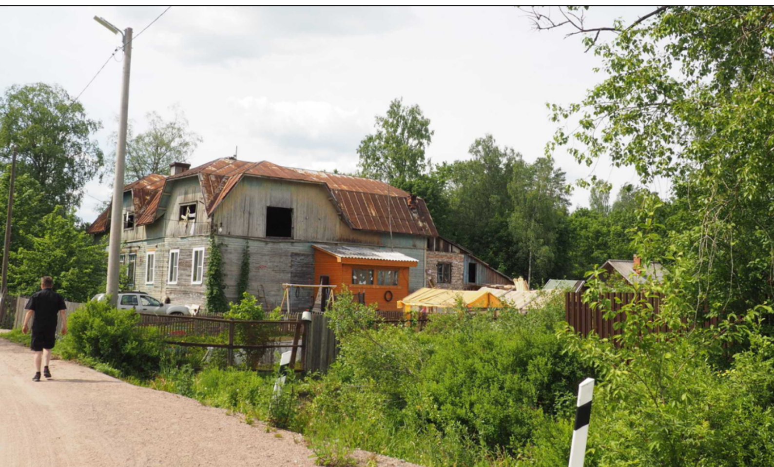
Kuva: Hannilan Osuuskaupan rakennus

Hannila on hiljainen kylä. Aseman seudulla ei ollut liikettä. Vanha osuuskaupan talo on saanut pienen kylkiäisen, eteisen tai varaston. Se oli hyvässä maalissa, vaikka päärakennus alkaa olla matkansa päässä. Yläkerrassa ei ollut edes ikkunoita, mikä jouduttaa talon lahoamista. Pihalla oli komea auto, mikä kielii kesäasukkaista. Heitä tulee sekä Viipurista että Pietarista. Vakinaista asutusta tuskin lienee paljoakaan. Vanhat suomalaistalot ovat kesäasuntoina ja uusia datsoja rakennetaan. Vanhat rakennukset ovat rapistumassa hitaasti mutta varmasti. Uusia rakennuksia on tullut vähän, joten vanha kylämiljöö on edelleen nähtävissä. Pietarin ja Viipurin vaurastuminen ei ole vielä vaikuttanut Hannilaan.