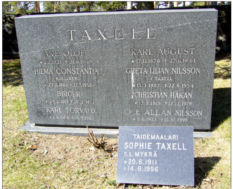
Kuva: Taxellin suvun hauta Hietaniemen hautausmaalla Helsingissä.

Palkinnot, kunniamerkit ja arvonimet: Kunniapalkinto "Kukkia ja taidetta" -näyttelyssä, USA 1978, Accademia Europea, Premio 1984-86, Targa D'Oro Assegnata Dalla Giuria, Accademia Italia, Calvatone, Premio D'Italia 1986, Premio Fiaccola D'Oro Conferito, Parlamento Mondiale USA. Ulkomaiset: Medal of Honor Commemorating Distinguished Lifelong Achievements 1989.