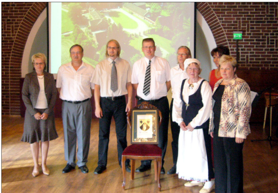
Kuva: Kannaksen Mykrät -sukuseuran uusi hallitus vaakunan ympärillä

Meillä on kuitenkin lupa ja kunnia palata Karjalaan tämän vaakunan suomin keinoin. Uskonkin, että moni teistä löytää luontevan ja hyvin turvallisen tien, sillan ylistettyyn ja rakastettuun Karjalaan. Julkaiskaamme nyt Kannaksen Mykrien oma vaakuna.